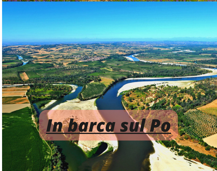
In barca sul Po