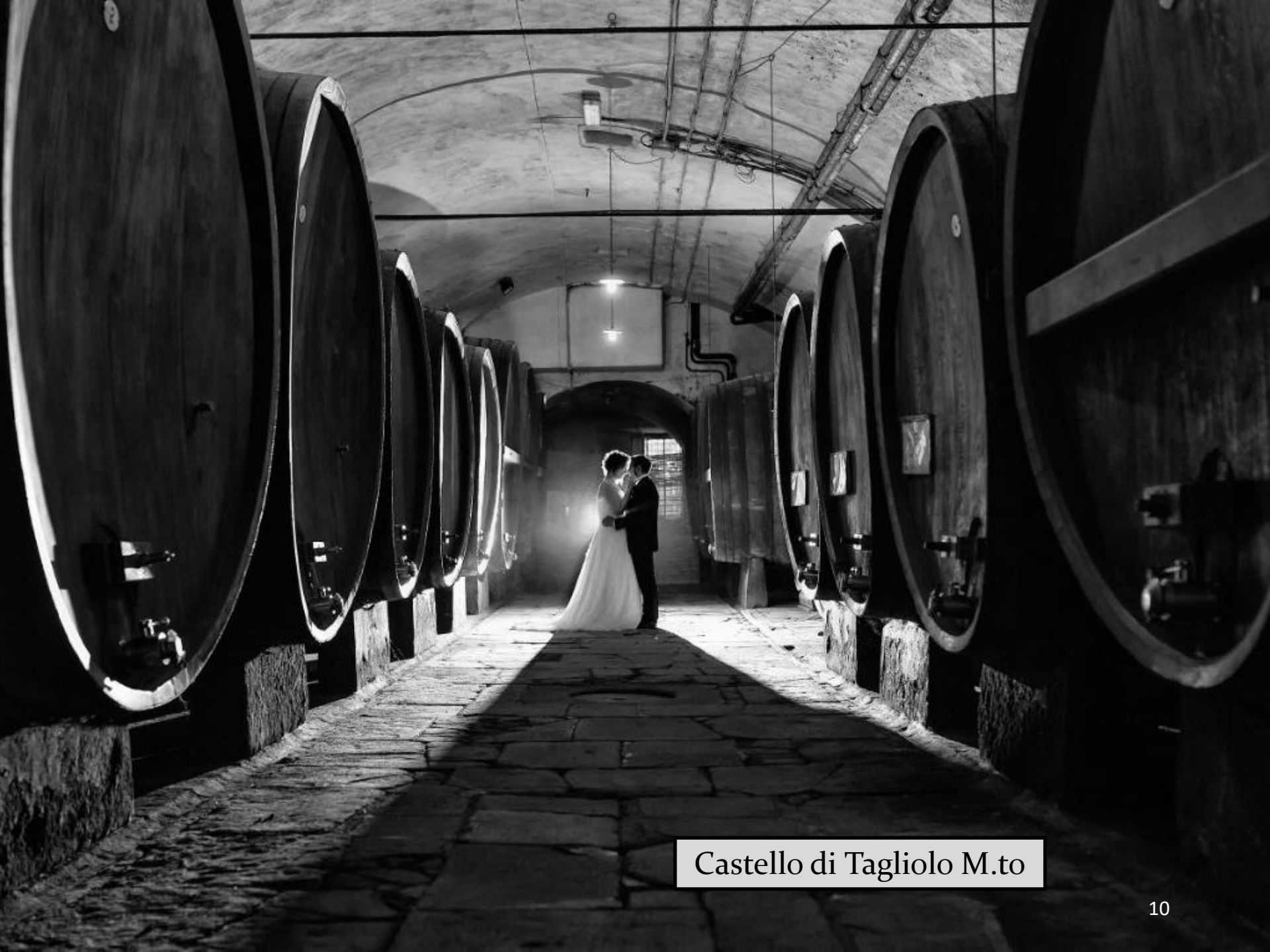
Castello di Tagliolo M.to