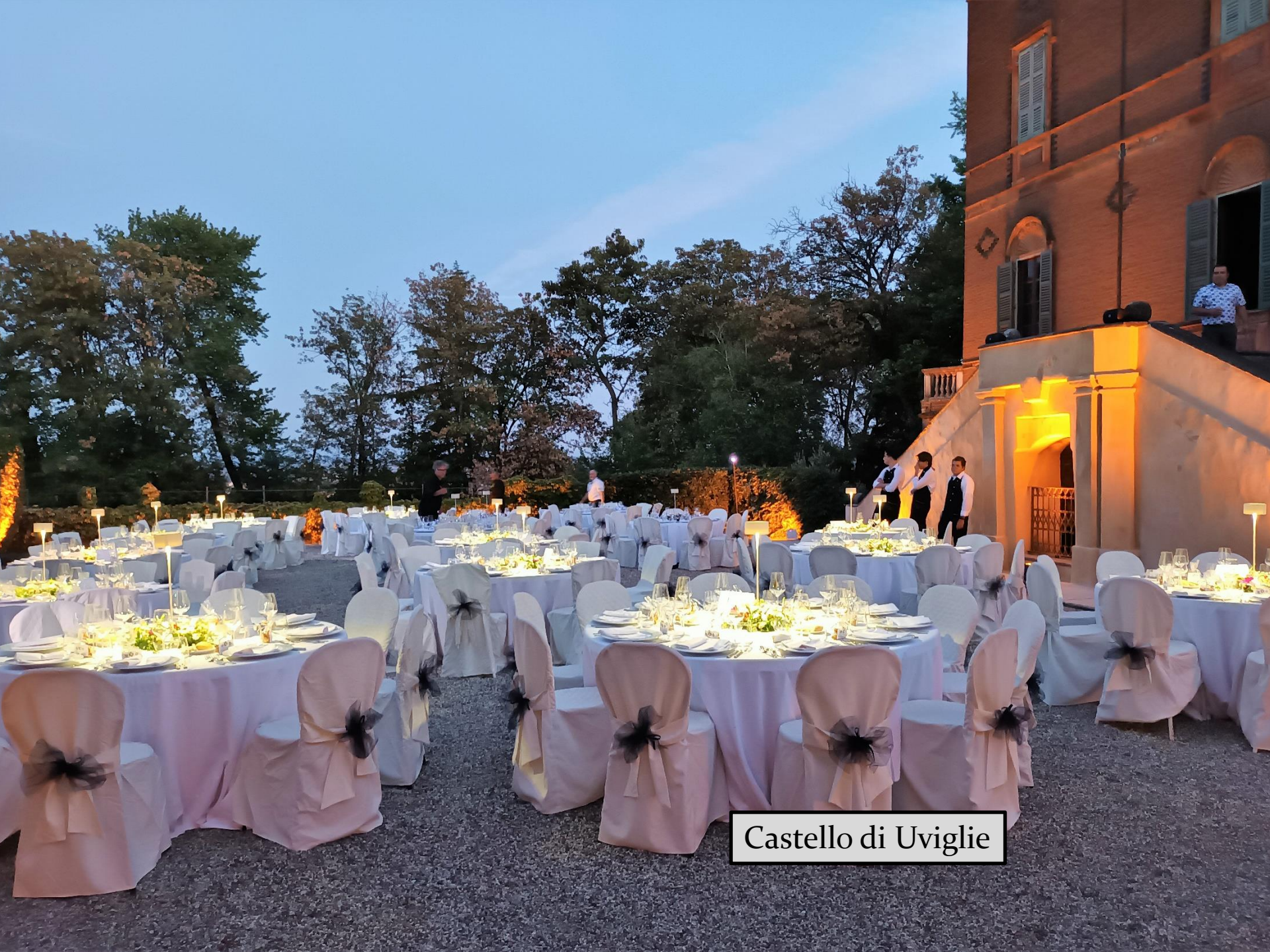
Castello di Uviglie