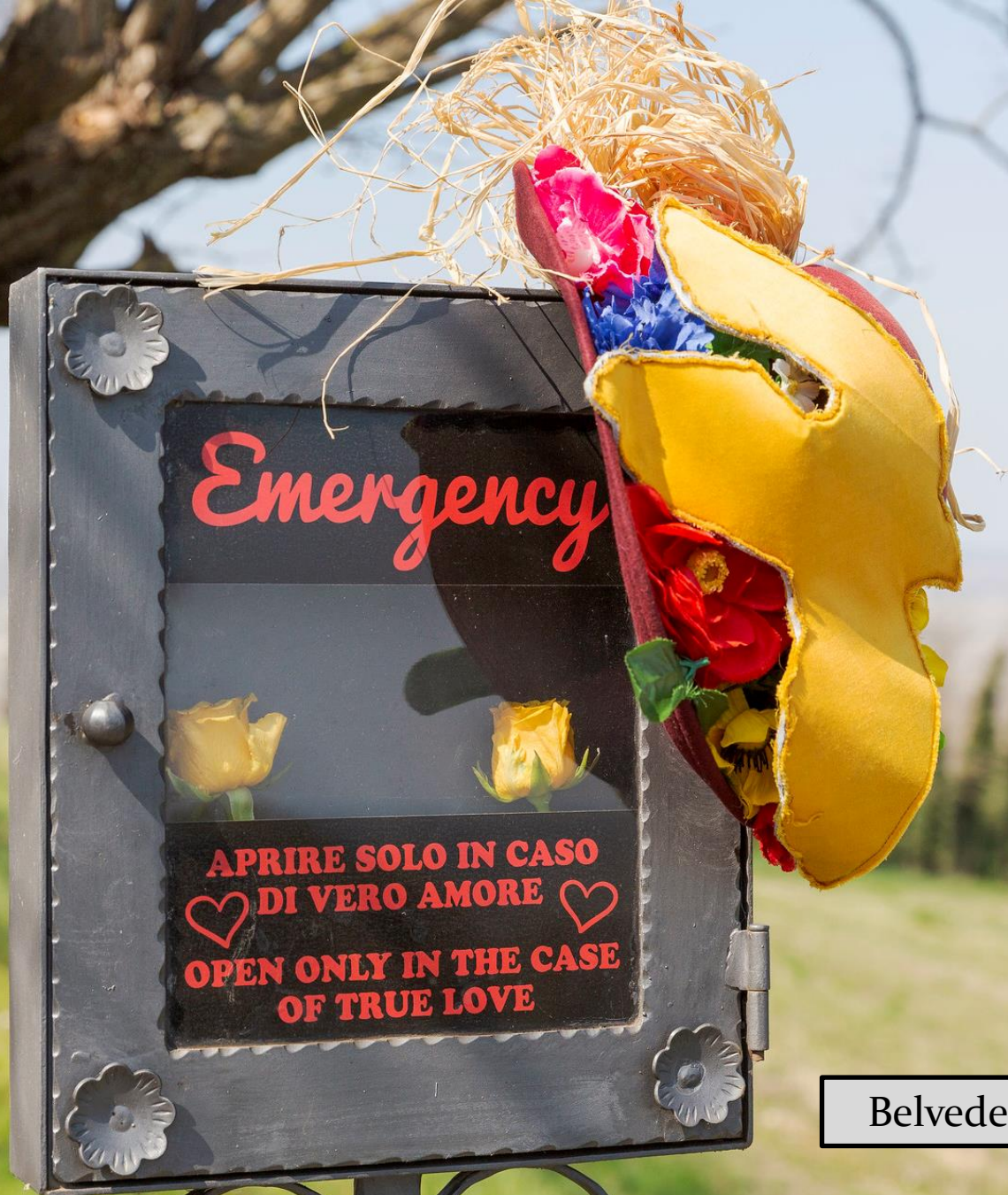
Belvedere di Coniolo