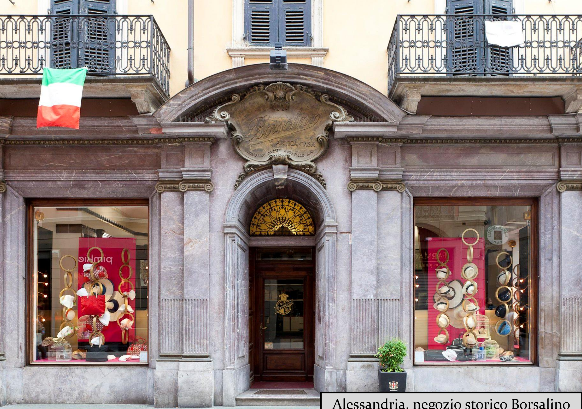
Alessandria, negozio storico Borsalino