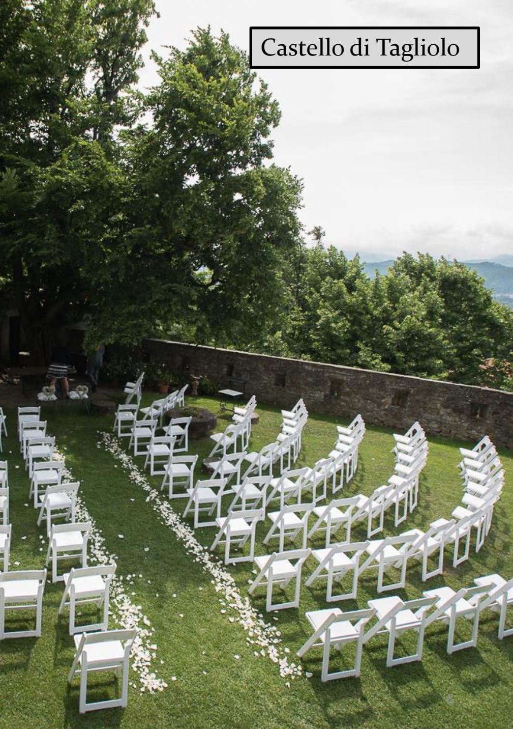
Castello di Tagliolo

ATL alexala AGENZIA TURISTICA LOCALE della Provincia di Alessandria