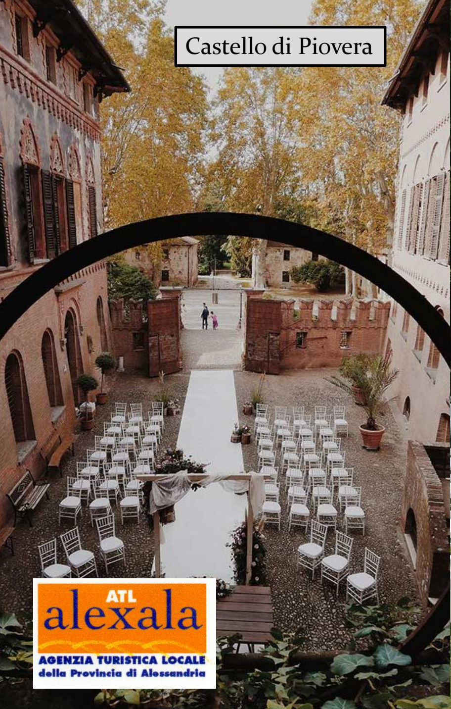
Castello di Piovera

ATL alexala AGENZIA TURISTICA LOCALE della Provincia di Alessandria