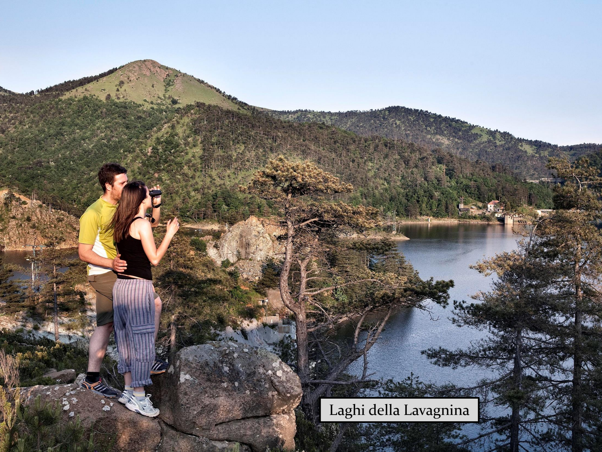
Laghi della Lavagnina